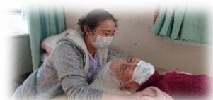
作業療法士による個別リハビリ