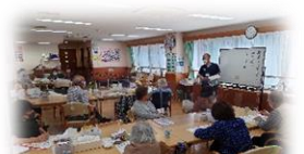
おとなの学校（月・金・土）